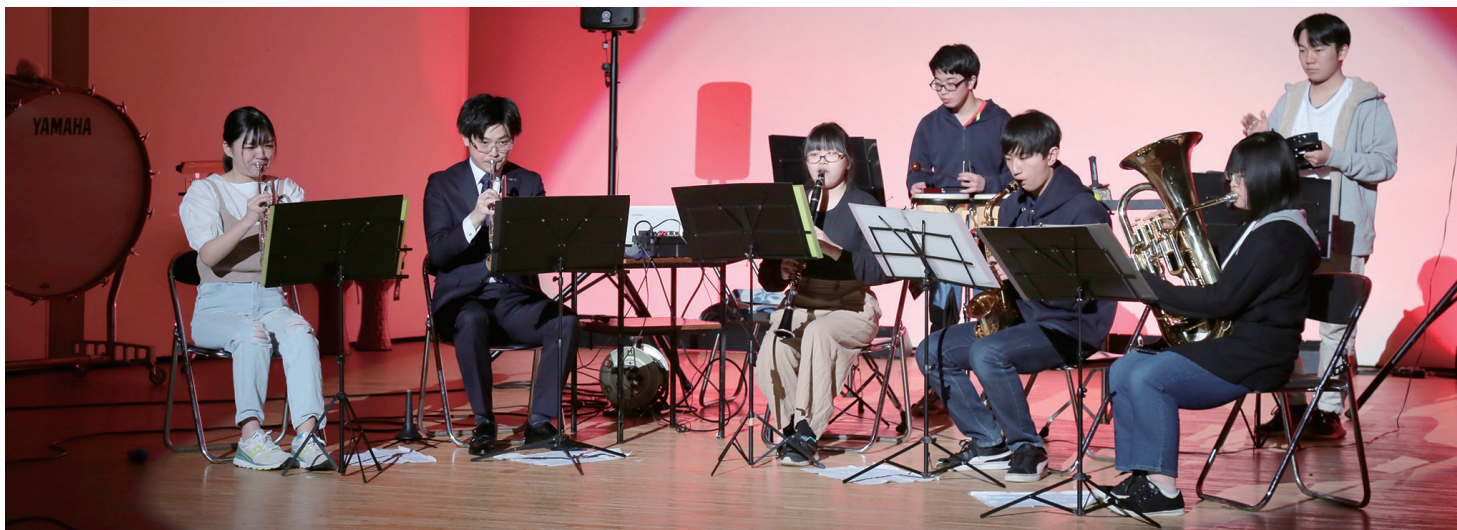
長万部中学校吹奏楽部定期演奏会(11月3日・写真上)、長万部高等学校吹奏楽部定期演奏会(11月21日・写真下)が行われました。ユーモアのある楽しいステージと素晴らしい演奏を披露し、心に響く演奏会となりました。