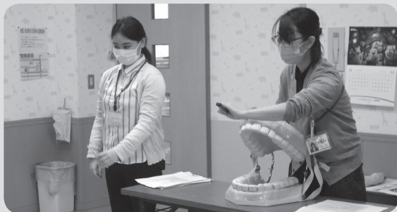
どこが汚れているかな？