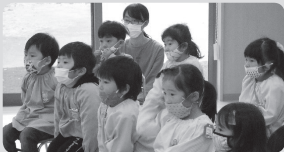
真剣にムッシバンのお話を聞いています。

子どもだけでは完璧に歯を磨くことは難しいので、仕上げ磨きも忘れずに行いましょう！