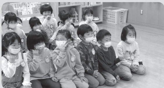
歯みがきゴシゴシ